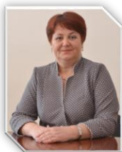
Sv. Cobîleanski Director adj. acrt. educaț. didact. si metodică Gr.didactic superior Gr.managerial I Merite deosebite Medalia Meritul Civic